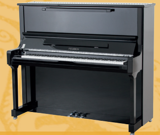
Mod. 133 - Concert