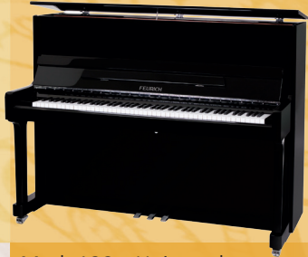
Mod. 122 - Universal