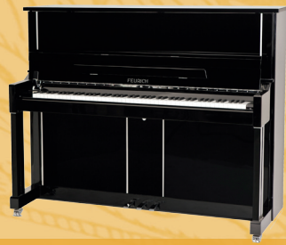
Mod. 125 - Design