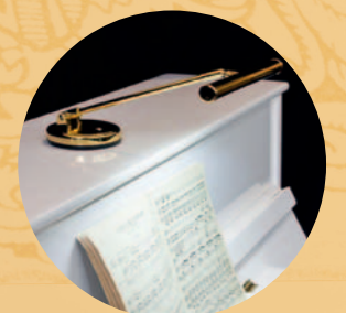
Lampes de pianos à LED

Avec ses instruments, FEURICH enchante le monde entier depuis plus de 160 ans. Nous savons allier facture instrumentale traditionnelle, innovations, et une production de pianos à la pointe de la modernité. Rendez nous visite sur feurich.com