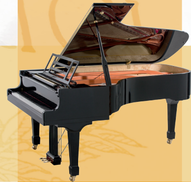
Mod. 218 - Concert I