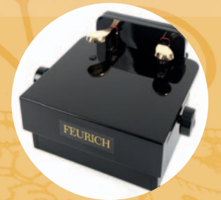
Réhausseur de pédales

Avec ses instruments, FEURICH enchante le monde entier depuis plus de 160 ans. Nous savons allier facture instrumentale traditionnelle, innovations, et une production de pianos à la pointe de la modernité. Rendez nous visite sur feurich.com