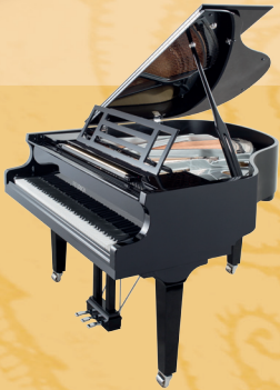
Mod. 162 - Dynamic I