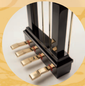
Pédale harmonique pour les pianos à queues