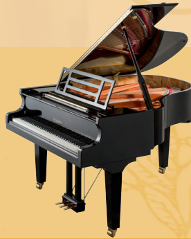
Mod. 179 - Dynamic II