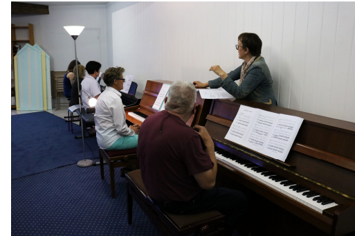
Cours de formation musicale adulte

La Plage Musicale propose des cours pour les enfants comme les adultes. Les musiciens débutants ou confirmés peuvent s'exercer à Quimperlé ou à Clohars-Carnoët. Originalité de la pédagogie Martenot : les professeurs proposent aux élèves de s'exercer en groupe au piano. En plus des cours individuels proposés, les professeurs enseignent aux élèves une pratique collective, rare sur cet instrument. Dès le plus jeune âge, les jeunes artistes en herbe, découvrent la liberté d'improviser.