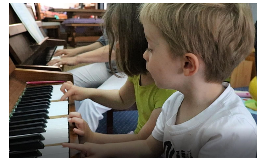
Cours d'éveil musical 3 - 6 ans